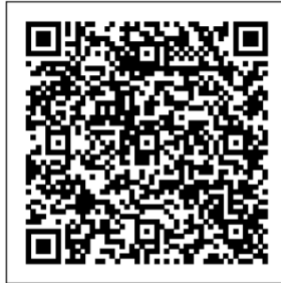
Link als 2D Barcode für Handy

Link zur Petition: openpetition.de/arheilgen